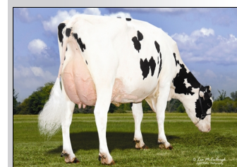
HILLTOP-LLC JETT AIR 4459