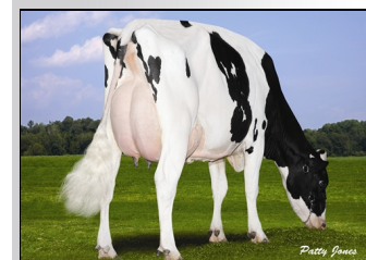
TWOMEIER JETT AIR 1956